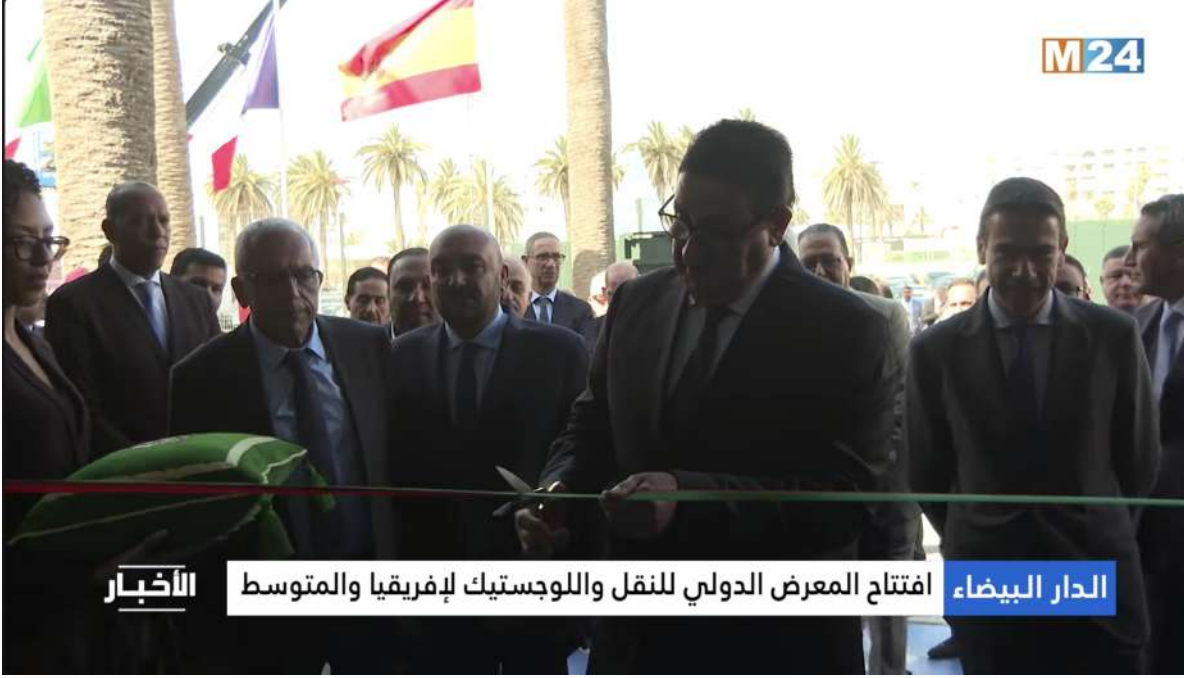
الأخبار الدار البيضاء افتتاح المعرض الدولي للنقل واللوجستيك لإفريقيا والمتوسط