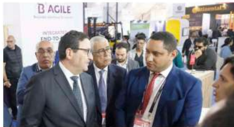
Ce salon se veut une plateforme de référence au service de l'ensemble de l'écosystème logistique national et international.