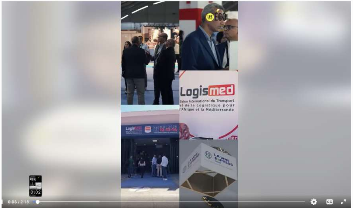
Logismed 2026 : connectivité, data et souveraineté au cœur des débats