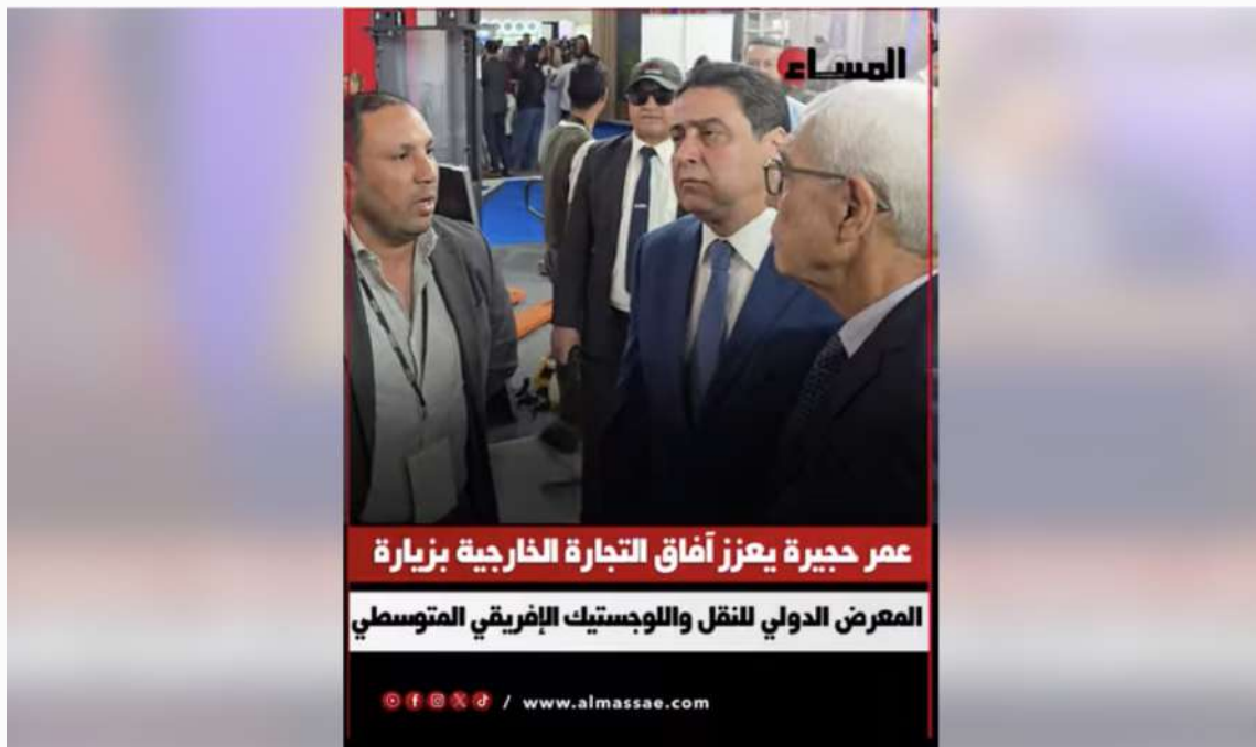
عمر حجيرة يعزز آفاق التجارة الخارجية بزيارة المعرض الدولي للنقل واللوجستيك الإفريقي المتوسطي www.almassae.com