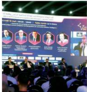
Cette édition a mis en avant le rôle stratégique du guichet unique numérique dans la modernisation du commerce extérieur et le renforcement de la compétitivité logistique du Maroc. (A. K.)

Rencontre » Placée sous le thème «Connecter les territoires au commerce mondial : le guichet unique comme catalyseur de l'écosystème du commerce extérieur intelligent», la 10 ème édition des Rencontres du Digital By PortNet a réuni des experts, des responsables institutionnels et des professionnels nationaux et étrangers pour débattre des enjeux de digitalisation, d'interopérabilité et de fluidification des échanges.