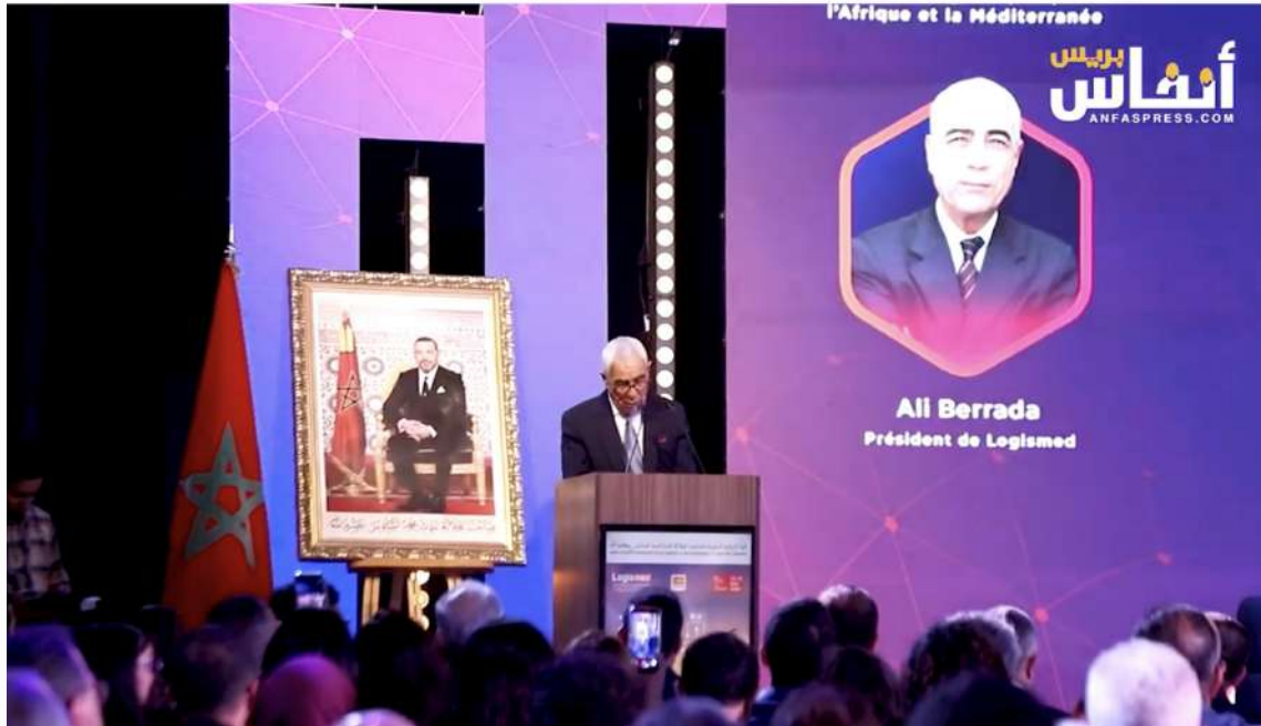
قبوح: تمت تعبئة مئات الهكتارات من المناطق اللوجستكية عبر تراب المملكة #عبد_الصادم_قبوح #اللوجستيك #المغرب #الاستثمار #البنيات_التحتية #النقل #التنمية_الاقتصادية...